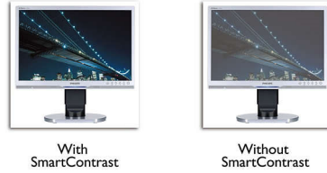
With SmartContrast Without SmartContrast

SmartContrast 是飞利浦推出的一项技术，当观看暗色调的视频或玩暗色调的游戏时，它会分析所显示的内容，自动调节色彩并控制背光亮度，从而实现对比度的动态增强，展现优异的数字画面。选择“节能”模式时，经过微调的对比度和背光可使日常办公应用程序呈现恰如其分的显示效果，将功耗保持在较低水平。