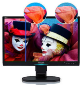
With WideColor Without WideColor

广色显示屏是一种液晶显示器，能够使用功能强大的改进型广色域冷阴极荧光灯背光和卓越的处理技术，将色彩范围从普通液晶屏所再现的 72% 的 NTSC 色域扩展到 102% 以上，从而显著地改善色彩的纯度及饱和度，能够显示更自然、更鲜艳的色彩。