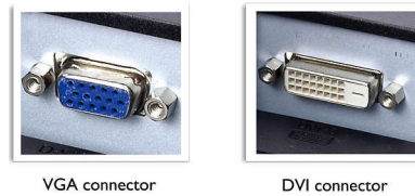
VGA connector DVI connector