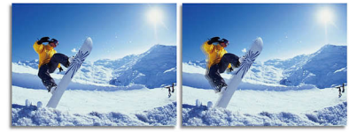
2ms GtG response time > 2ms GtG response time

SmartResponse 是飞利浦独有的驱动加速技术。启动时, 它会根据特定应用程序要求自动调整响应时间, 如游戏和电影需要更快的响应才可产生颤抖、时间迟滞和无重像影像