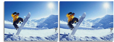
2ms GtG response time > 2ms GtG response time

SmartResponse 是飞利浦独有的驱动加速技术。启动时, 它会根据特定应用程序要求自动调整响应时间, 如游戏和电影需要更快的响应才可产生颤抖、时间迟滞和无重像现象。