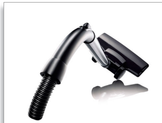
带简易手柄的地板套件