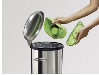
旋风集尘桶，容量 1 升