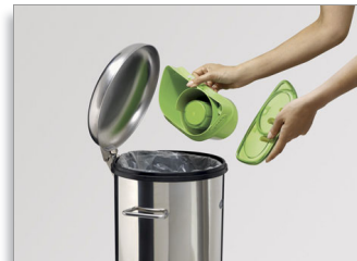
旋风集尘桶，容量 1 升