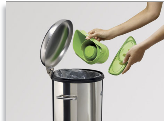
旋风集尘桶，容量 1 升