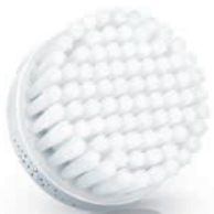
NORMAL brush head / 普通刷头 (SC5990)