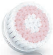
SENSITIVE brush head / 敏感刷头 (SC5991)