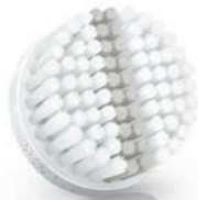
EXFOLIATION brush head / 去角质刷头 (SC5992)

2 Special needs and care / Kebutuhan dan perawatan khusus / keperluan dan penjagaan khas / ความต้องการและการดูแลพิเศษ / 特殊需求與保養 / 特殊需要和护理