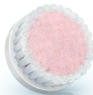
EXTRA SENSITIVE brush head / 超敏感刷头 (SC5993)