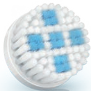
DEEP PORE Cleansing brush head / 去黑头刷头 (SC5996)