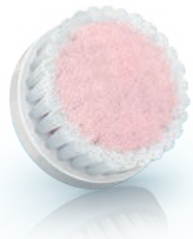
EXTRA SENSITIVE brush head / 超敏感刷頭 (SC5993)

2 Special needs and care / Kebutuhan dan perawatan khusus / keperluan dan penjagaan khas / ความต้องการและการดูแลพิเศษ / 特殊需求與保養 / 特殊需要和护理