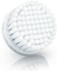
NORMAL brush head / 普通刷頭 (SC5990)