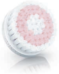
SENSITIVE brush head / 敏感刷頭 (SC5991)