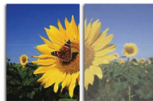
With SmartImage Without SmartImage

SmartImage é uma tecnologia líder exclusiva da Philips que analisa o conteúdo apresentado no seu ecrã e lhe proporciona um desempenho de apresentação otimizado. Esta interface de fácil utilização permite-lhe seleccionar vários modos como Escritório, Fotografia, Filme, Jogo, Economia, etc., para adaptar a aplicação em utilização. Com base na selecção, a tecnologia SmartImage otimiza, de forma dinâmica, o contraste, a saturação da cor e a nitidez das imagens e vídeos para um desempenho de imagem excelente. A opção do modo Economia permite-lhe enormes poupanças de energia. Tudo em tempo real e através de um simples toque num botão!