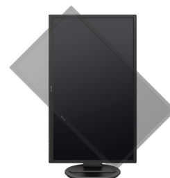
Imagem nítida, desempenho eficiente