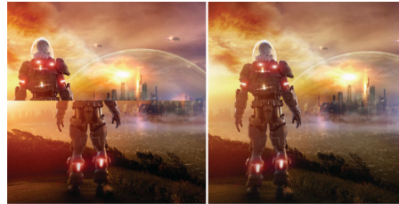
AMD FreeSync™ OFF (simulação)