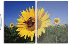
With SmartImage Without SmartImage

SmartImage é uma tecnologia líder exclusiva da Philips que analisa o conteúdo apresentado no seu ecrã e lhe proporciona um desempenho de apresentação optimizado. Esta interface de fácil utilização permite-lhe seleccionar vários modos como Escritório, Fotografia, Filme, Jogo, Economia, etc., para adaptar a aplicação em utilização. Com base na selecção, a tecnologia SmartImage optimiza, de forma dinâmica, o contraste, a saturação da cor e a nitidez das imagens e vídeos para um desempenho de imagem excelente. A opção do modo Economia permite-lhe enormes poupanças de energia. Tudo em tempo real e através de um simples toque num botão!